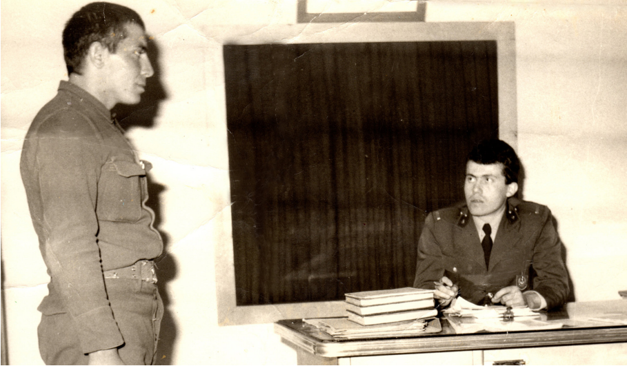
Şaovşat Askerlik Şubesi Başkan Vekilliği