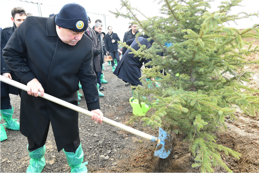
150. Yıl Hatıra Ormanı Fidan Dikim Töreni (01 Mart 2018)