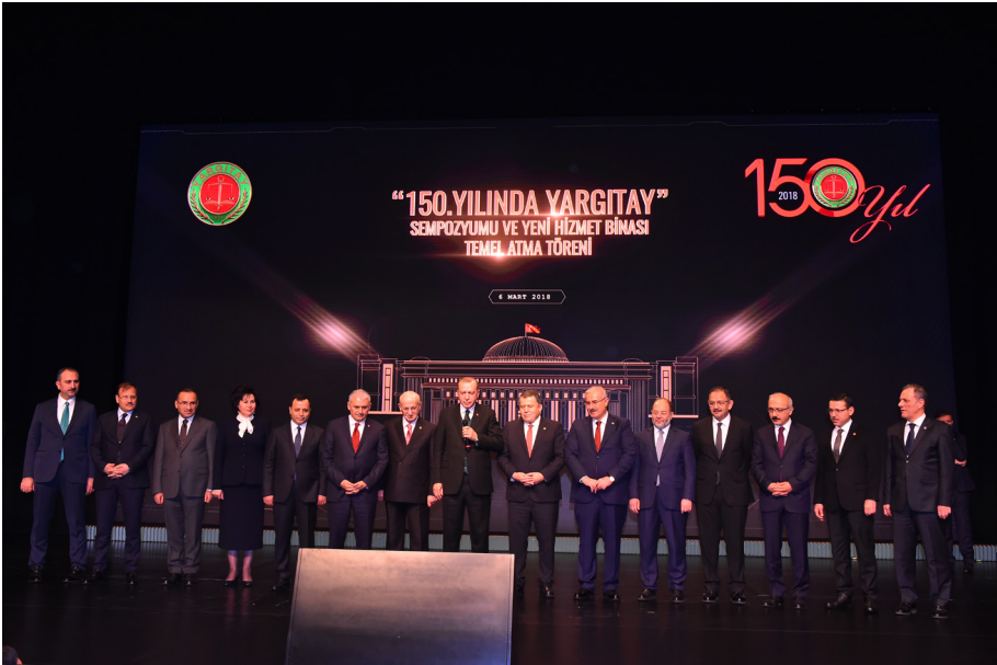
150. Yılında Yargıtay Sempozyumu ve Yargıtay Yeni Hizmet Binası Temel Atma Töreni (06 Mart 2018)