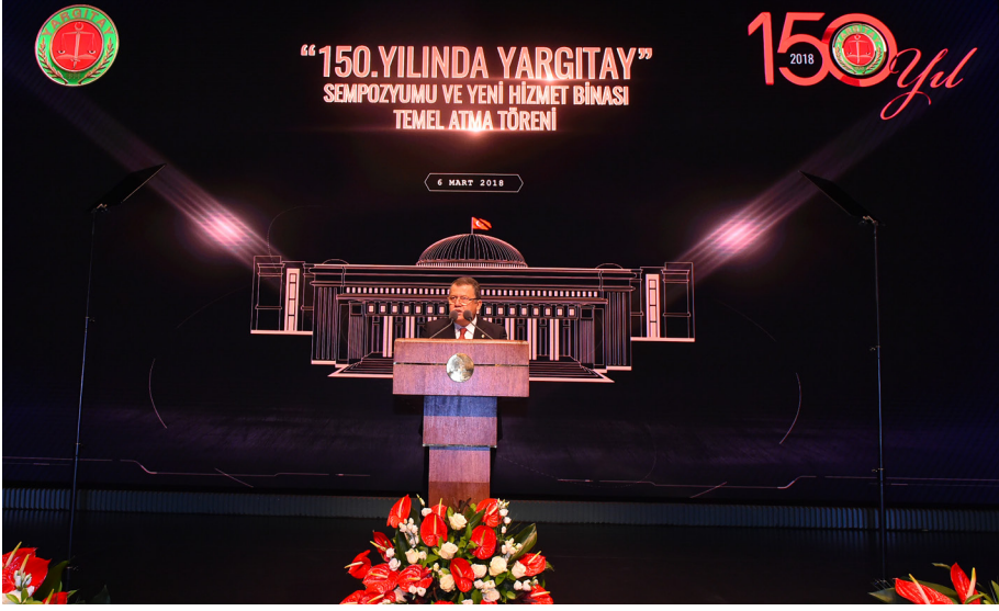
150. Yılında Yargıtay Sempozyumu ve Yargıtay Yeni Hizmet Binası Temel Atma Töreni (06 Mart 2018)