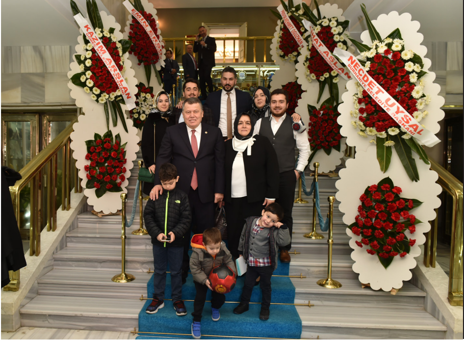
Mazbata Töreni (11 Şubat 2019)